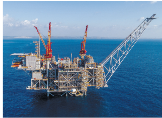
אסדת לווייתן

מי לא רוצה להשקיע בסטארט-אפ, לעשות אקזיט ולהי רוויח מיליוני שקלים? החדשות הטובות הן שיש כוון שאתם כבר משקיעים בסטארט-אפ מבלי ששמתם לב; החדשות הרעות הן שאף אחד לא יכול להבטיח לכם שמדובר בסטארט-אפ שיניב אקזיט ולא ייבשל.